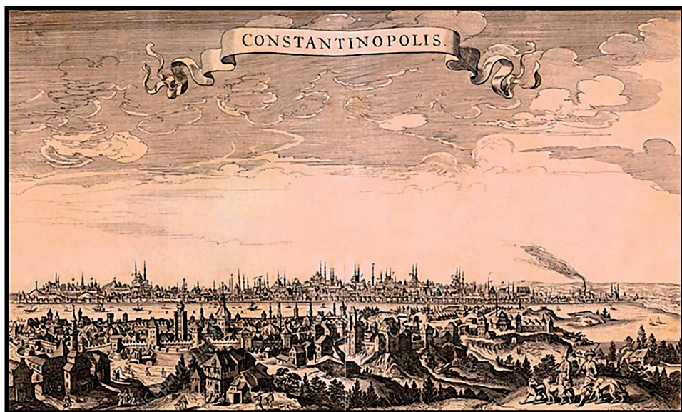
Ромбу ван ден Хој (Rombout van den Hoeye), Цариград (1650)