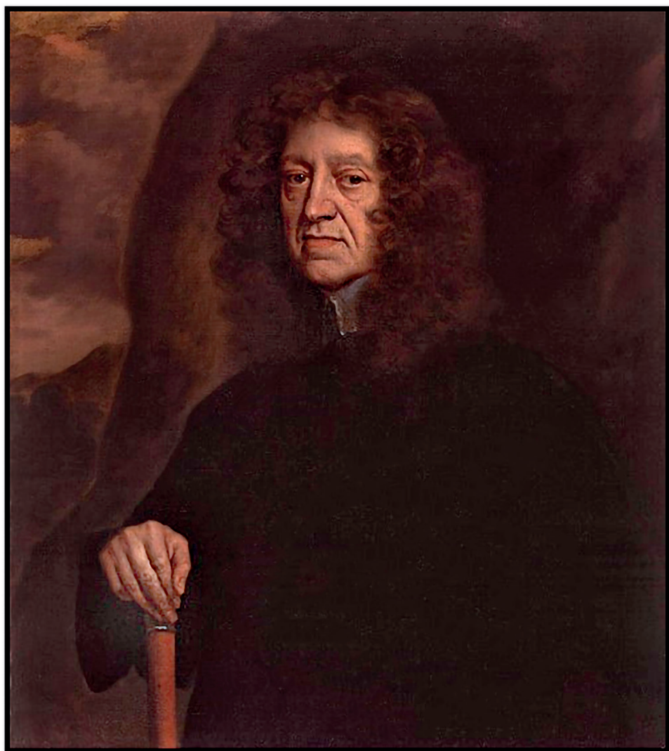
Сер Питер Лели (Peter Lely), Сер Хенри Блаунт (1679)

Блаунт је сазнао о два ретким стварима које карактеришу ушће Београда, а то је, прво, у шта је имао и сам прилике да се увери, да у подне и у поноћ Дунав тече спорије, и друго, да се ове две реке од ушћа па надаље не мешају, као вода и уље. Окусио је воду обе реке и објаснио разлику: вода Дунава је јасна и чиста, док је вода Саве мутна као улични канал, и осетио је песак у устима, али ипак није била масна као што је очекивао; но, и поред тога није му се свидела (Blunt 1669: 14–15).