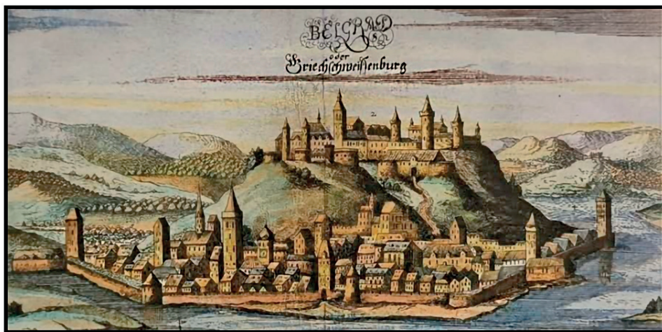
Проспект Београда у XVII веку (Wagner 1685)

натписом цара Фердинанда. Оно што се Блаунту учинило најчудније у калемегданској тврђави, у коју је могао да „завири“ у горњем и доњем делу, јесте велика округла кула, названа Зиндан, чија округлост несумњиво није оригинална јер је слична римским scalae Gemoniae . Могуће је да Блаунт овде ( Ibid. : 15) мисли на Зиндан капију, за коју Срби знају да је то име добила у XVIII веку (Марјановић-Вујовић, Поповић 1968), кад су Турци ову испрва одбрамбену капију користили као затвор (зиндан), мада је Блаунт као такву помиње у суштини век раније. За Зиндан капију каже и да је била прекривена гредама, а свака греда имала је велике куке за месо, па је осуђеник био го пуштан да падне међу те куке, што му је доносило брзу или трајну патњу. Ако се узме у обзир да најстарији планови Београда потичу из девете деценије XVII века (Павловић 2006: 31; уп. Бајаловић-Хаџи-Пешић 1991; Поповић 2006), ови подаци свакако доприносе познавању морфологије тврђаве пре тога времена. С обзиром да је Зиндан капија у ствари капија града, а не тврђаве, Блаунт каже да се унутар овог великог „замка“ налазио још један мањи „замак“.